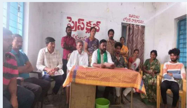
బేకులపల్లి, మన భద్రాద్రి స్కూల్, జనవరి 24

బేకులపల్లి మండలంలోని కొత్తతండా (పీ) గ్రామానికి చెందిన కొందరిపై అధికార పార్టీకి చెందిన ఓ వ్యక్తి అధికార బలంతో అక్రమ కేసులు పెట్టింది ఇబ్బందులు గురి చేస్తున్నట్లు సేవాలాల్ సేన రాష్ట్ర ఉపాధ్యక్షుడు రవి రాథోడ్ తెలిపారు. బాధితులతో కలిసి ఆయన మాట్లాడారు. బేకులపల్లి మండలంలోని కొత్తతండా (పీ) గ్రామంలో ఇటీవల జరిగిన కొన్ని సంఘటనల్లో అదే గ్రామ అధికార పార్టీకి చెందిన భూక్య సరిహద్దు పోలీసులతో అన్యాయంగా కేసులు పెట్టి ఇబ్బందులకు గురి చేస్తున్నారని ఆరోపించారు. గ్రామంలో ఓ కుటుంబం ఇంటికి వెళ్లి వారిని కొట్టి మరలా వారిపైనే కేసులు పెట్టించినట్లు తెలిపారు. ఓ మహిళ పురుగుల మందు తాగి మరణిస్తే మృతి కారణాలు తెలుసుకోవడానికి పోలీస్ స్టేషన్ కి ఫిర్యాదుకు వెళ్లే వారిపైనే దాడి చేశారన్నారు. ఓ కుటుంబం పండుగకు ఊరు వస్తే కుటుంబీకుల మధ్య చిన్న గొడవ జరిగితే ఇరువురు మధ్య కేసులు పెట్టించి ఇబ్బందులు పెట్టించారన్నారు. వదో తరగతి విద్యార్థి ఇంటికి వస్తుంటే తన తాతను తిడితే ఎందుకు తిడుతున్నామని పశ్చించినందుకు గాయాలయ్యేలా కొట్టారు. అధికార బలంతో కేసులు అన్యాయంగా పెట్టి ఇబ్బందులకు గురి చేస్తున్నట్లు వెల్లడించారు. పోలీసులు కేసులను పూర్తి స్థాయిలో విచారణ చేసి న్యాయం చేయాలని, అధికార పార్టీ చెందిన నాయకులు చెప్పింది విని, తిరిగి తమపైనే కేసులు నమోదు చేస్తున్నారని బాధితులు ఆవేదన వ్యక్తం చేశారు. విషయాన్ని ఉన్నతాధికారుల దృష్టికి తీసుకెళ్లినా నాయుం జరగడం లేదని, అక్రమ కేసులు పెట్టి భయభ్రాంతులకు గురి చేస్తున్నట్లు తెలిపారు. బాధితులు భూక్య లక్ష్మి, భూక్య బాలాజీ, మాలోత్ చందు, భు భాను ప్రకాష్, భూక్య పద్మ, భూక్య సునీత, బానోత్ కళ్యాణ్, భూక్య గణేష్, భూక్య శ్రీకాంత్, భూక్య రాంపరత్, తదితరులు పాల్గొన్నారు.