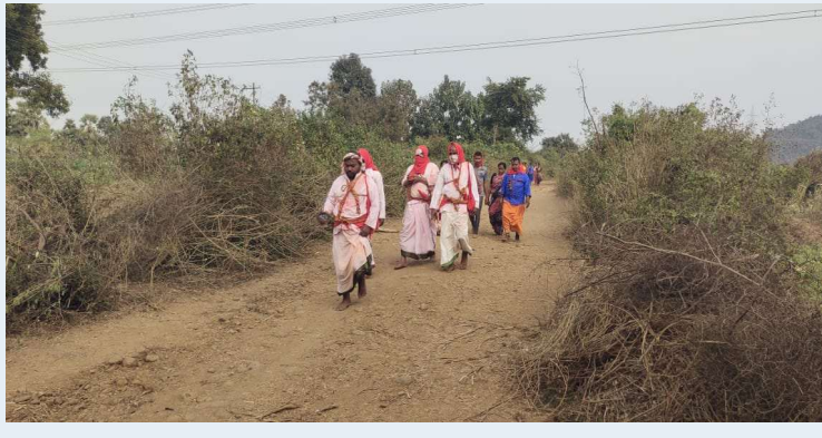
జూలూరుపాడు, మన భద్రాద్రి స్కూల్, జనవరి 24

ప్రపంచ ప్రసిద్ధ గిరిజన దేవతలైన సమృద్ధి సౌరకృష్ణ మహా జాతర జయ జయ ద్వారా నడుచు ఘనంగా ముగిసింది జాతర అనంతరం సాంప్రదాయ బద్ధంగా నిర్వహించిన వన ప్రవేశ కార్యక్రమంతో దేవతలు తిరిగి అడవిలోకి వెళ్లినట్లు గిరిజనులు విశ్వసించారు. గిరిజనులు ఆరాధ్య దేవతలైన సమృద్ధి సౌరకృష్ణల అన్యాయ పాలకులపై పోరాటం చేసిన అనంతరం సాధారణ మరణం చెందకుండా అడవి దేవతలుగా విలీనమయ్యారని పురాణ గాథలు చెబుతున్నాయి. ఈ విశ్వాసానికి ప్రతీకగా ప్రతి జాతర ముగింపులో వనప్రవేశం ఆచారం నిర్వహిస్తారు. వనప్రవేశం సందర్భంగా సమృద్ధి వన చెట్టు వద్ద సౌరకృష్ణ కుంకుమ చెట్టు వద్ద ప్రతీకాత్మకంగా పూజించి అడవిలోకి పంపారు. వేలాదిమంది భక్తులు ఈ కార్యక్రమాన్ని తిలకించి భక్తిశ్రద్ధలతో మొక్కులు తీర్చుకున్నారు. బెల్లం సమర్పనలతో జాతర ప్రత్యేక ఆకర్షణగా నిలిచింది. వన ప్రవేశంతో పడమటి నరసాపురం జాతర ముగియడంతో భక్తులు భావోద్వేగానికి లోనయ్యారు గిరిజన సంస్కృతి సాంప్రదాయాలకు ప్రతీకగా నిలిచిన సమృద్ధి సౌరకృష్ణ జాతర వానప్రవేశంతో ముగియడం ద్వారా ప్రకృతితో మానవుని అనుబంధాన్ని చాటిందని పలువురు అభిప్రాయపడ్డారు.