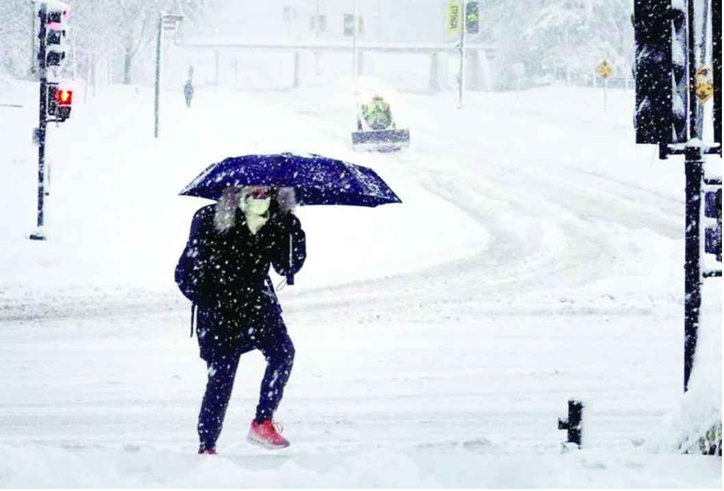
పేరుకుపోయే ప్రమాదం ఉంది. దీనివల్ల విద్యుత్ లైన్లు తెగిపోయి, చెట్లు కూలిపోయి సుదీర్ఘకాలం పాటు విద్యుత్ సరఫరాలో అంతరాయాలు ఏర్పడవచ్చని అధికారులు ఆందోళన వ్యక్తం చేస్తున్నారు. టెక్సాస్‌లో ఇప్పటికే దాదాపు 20,000 మంది, ఓక్లహోమా, ఆరొన్సాస్‌లలో వేలాది మంది విద్యుత్ లేకుండా ఇబ్బందులు పడుతున్నారు. 2021 నాటి విద్యుత్ సంక్షోభం నుంచి పాఠాలు నేర్చుకున్నామని, ఈసారి విద్యుత్ గ్రెడ్‌ను సిద్ధంగా ఉంచామని టెక్సాస్ అధికారులు చెబుతున్నారు. ప్రభుత్వ యంత్రాంగం పూర్తిస్థాయిలో అప్రమత్తమైంది. ఫెడరల్ ఎమర్జెన్సీ మేనేజ్‌మెంట్ ఏజెన్సీ దాదాపు 30 సహాయక బృందాలను సిద్ధంగా ఉంచింది. ఆహారం, దుస్తులు, జనరేటర్లను కీలక ప్రాంతాలకు

తరలించింది. పలు రాష్ట్రాల్లో నేషనల్ గార్డ్ దళాలను మోహరించారు. వాషింగ్టన్ డి.సి. మేయర్ మురియల్ బొజర్ మాట్లాడుతూ, “మేము అధికారికంగా స్టేట్ ఎమర్జెన్సీ, స్టేట్ ఆఫ్ ఎమర్జెన్సీని ప్రకటించాం” అని తెలిపారు. చికాగోలో పాఠశాలలకు సెలవులు ప్రకటించగా, లూసియానాలో కార్నివాల్ పరేడ్‌లు, నాస్‌విల్లేలో పలు కార్యక్రమాలు రద్దయ్యాయి. ఈ తుపాను సోమవారం వరకు కొనసాగి, న్యూయార్క్, టోన్సీ వంటి ప్రధాన నగరాలపై ప్రభావం చూపనుంది. తుపాను తగ్గుముఖం పట్టినా, ఆ తర్వాత కూడా అత్యంత శీతల గాలులు, ప్రమాదకరమైన వాతావరణం కొనసాగుతుందని, ప్రజలు అత్యవసరమైతే తప్ప ఇళ్ల నుంచి బయటకు రావద్దని అధికారులు హెచ్చరిస్తున్నారు.