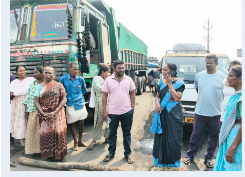
మణుగూరు, మన భద్రాద్రి స్టూన్, ఫిబ్రవరి 23

భద్రాద్రి పవర్ ప్లాంట్ ద్వారా వచ్చే బూడిద వల్ల గాలి, నీరు కలుషితమవుతున్నాయని, ధమ్ముక్కపేట గ్రామ పంచాయతీ ప్రజలు సోమవారం బొగ్గు లారీలను అడ్డుకున్నారు ఈ సందర్భంగా దమ్ముక్కపేట, చిక్కురు గుంట ప్రజలు మాట్లాడుతూ.. బిడిపిఎస్ గోడను ఆనుకొని చిక్కురు గుంట గ్రామం ఉన్నదన్నారు. ప్రహారీ గోడ వెంబడి బొగ్గు లారీల కారణంగా విపరీతమైన బొగ్గుమార దుమ్ము ఇండ్లపై పడుతుందని ఆవేదన వ్యక్తం చేశారు. 24 గంటలు నిరంతరాయంగా నివాసాలపై బూడిద పడుతుందన్నారు. నీరు, గాలి విపరీతంగా కలుషితం అవుతున్నాయని ఆవేదన వ్యక్తం చేశారు. ఈ విషయంపై బిడిపిఎస్ సిఈ బి బిన్నన్న తో మాట్లాడుతూ, సుమారు మూడు కోట్ల రూపాయలు జిల్లా కలెక్టర్ వద్ద ఉన్నాయని వాటిని వినియోగించుకోవాలని తెలిపారు. కోట్లలో సిఎన్ఆర్ నిధులు మా గ్రామాలకు వినియోగించకుండా వేరే ప్రాంతాలకు తరలిస్తున్నారని ఆవేదన వ్యక్తం చేశారు. అనారోగ్యాల పాలవుతున్నామని అన్నారు. ఊపిరితిత్తులు క్యాన్సర్ లాంటి వ్యాధులు బారినపడి అవస్థలు పడుతున్నామని ఆందోళన వ్యక్తం చేశారు.