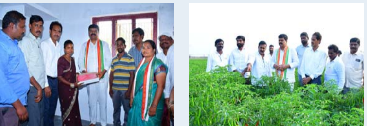
బూర్గంపాడోడ్, మన భద్రాద్రి స్మార్స్, ఫిబ్రవరి 23