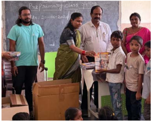
కొరారు. విద్యాభివృద్ధికి తోడ్పడే కార్యక్రమాల్లో సమాజంలోని ప్రతి వర్గం భాగస్వాములు కావాలని పిలుపునిచ్చారు. ఈ కార్యక్రమంలో