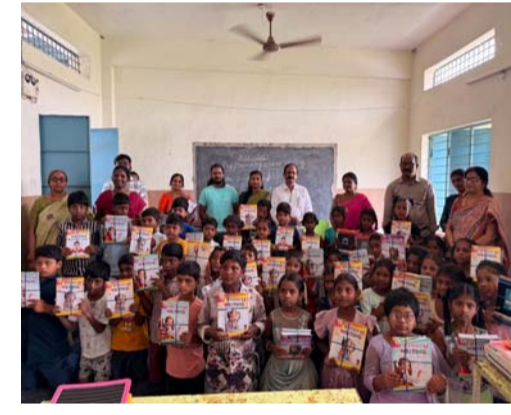
పాఠశాల ప్రధానోపాధ్యాయులు, ఉపాధ్యాయులు, విద్యార్థులు, తల్లిదండ్రులు, స్థానిక ప్రముఖులు తదితరులు పాల్గొన్నారు.