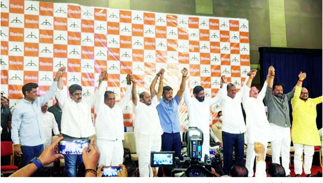
టైగర్ సక్సెస్ అయ్యింది.”